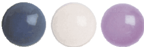
Verunreinigungen vor und nach der Reinigung. Links: mit blauem Farbstoff sichtbar gemachte Verunreinigungen. Rechts: Mit üblichem Handelsprodukt gereinigte Linse. Mitte: Mit Lösung „Reinigen R“ behandelte Linse 1 .

Contopharma „Reinigen R“ ist das Resultat einer längeren Entwicklung 1 auf der Suche nach einer nicht abrasiven (zur Schonung der Linsen), tensidhaltigen Formulierung mit hoher Reinigungskraft ohne übermässige Reizungen bei direktem Augenkontakt. Contopharma „Reinigen R“ ist frei von schwermetallhaltigen Desinfektionsstoffen.